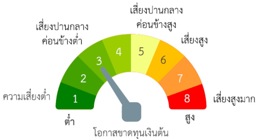
แผนภาพแสดงตำแหน่งความเสี่ยงของกองทุนรวม