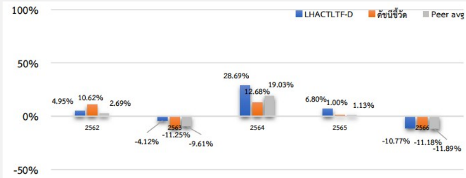
ผลการดำเนินงานย้อนหลังแบบปีกumul (%ต่อปี)