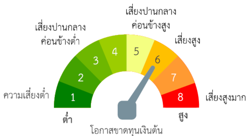
แผนภาพแสดงตำแหน่งความเสี่ยงของกองทุนรวม