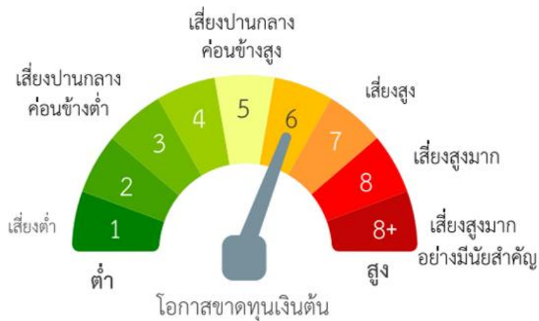
แผนภาพแสดงตำแหน่งความเสี่ยงของกองทุนรวม