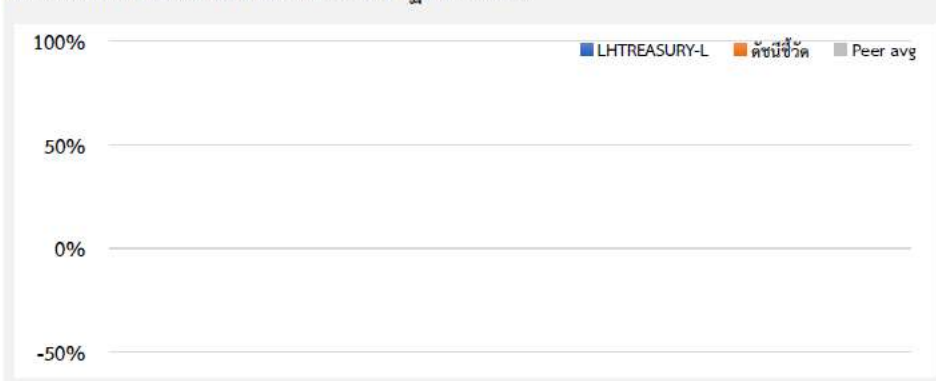
ผลการดำเนินงานย้อนหลังแบบปีกลม (%ต่อปี)