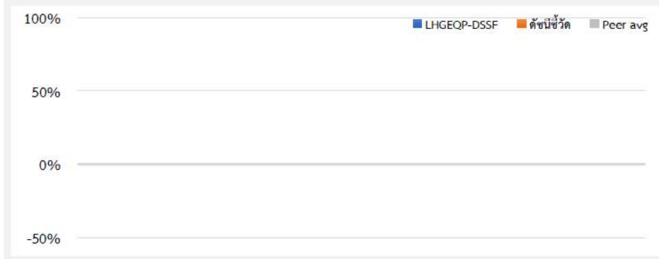
ผลการดำเนินงานย้อนหลังแบบปักหมุด ( 1 %ต่อปี)