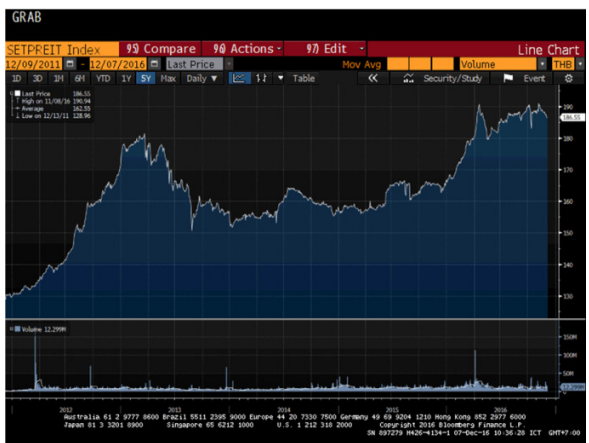
ดัชนีกองทุนรวมอสังหาริมทรัพย์และกองทรัสต์เพื่อการลงทุนในอสังหาริมทรัพย์

หมายเหตุ : ข้อมูลย้อนหลังตั้งแต่ 9 ธ.ค. 54 – 7 ธ.ค. 59